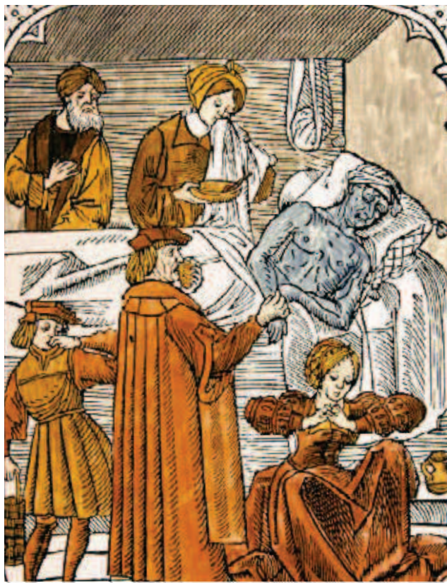
UN MÉDICO VISITA a un afectado por la peste. Grabado sobre madera coloreado perteneciente al siglo xv.